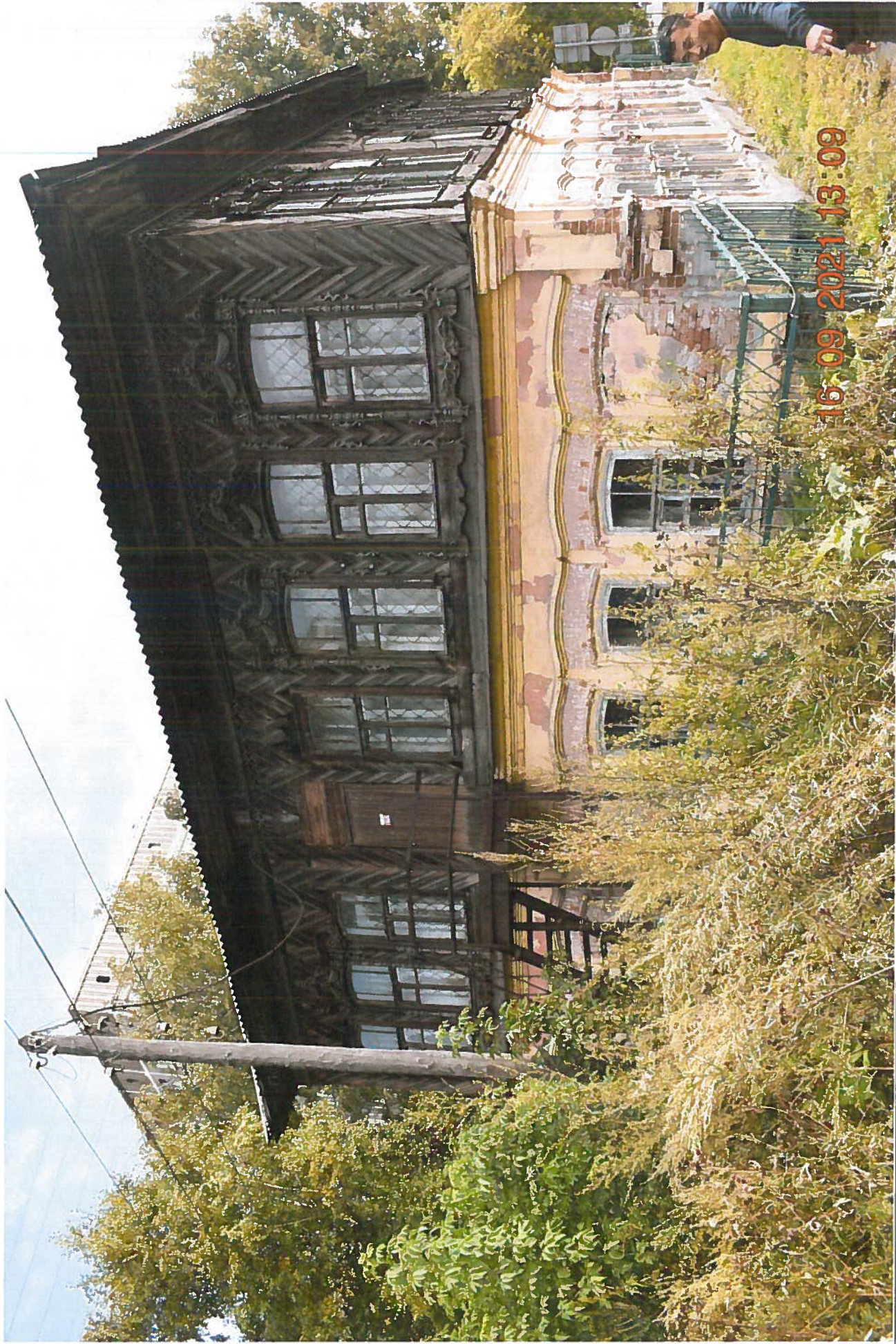
объект культурного наследия местного (муниципального) значения «Дом купца Фонарева»

адрес места нахождения: Кемеровская область - Кузбасс, г. Новокузнецк, ул. Володарная, д. 19